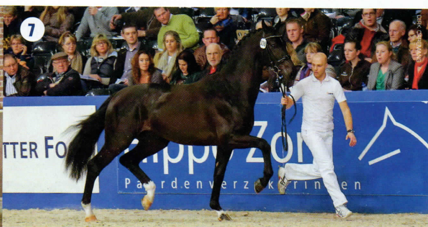
6. VSN-Trofee winnaar Atomic is een zoon van Ampère (mv.Tolando). 7. Ook in de kampioenskeuring 's-Hertogenbosch: Fellini (mv.Jazz).

mijn gevoel omdat hij in shows en dergelijke als jong paard overvraagd is. Dat is altijd een groot gevaar als je een fantastisch jong paard hebt. Wij hebben het eerste jaar heel rustig aan gedaan. Veel buiten gereden in het bos, zonder enkele druk erop. Niets moest. Ook geen shows. Van daaruit zijn we hem langzaam op gaan bouwen. Maar nog altijd wisselen we het buiten rijden en trainen veel af. Hij is nu gelukkig weer een 'happy horse'. Als we hem op een show voorstellen, doen we dat op een relaxte manier. Dus geen uitgestrekte draf en passage-achtige toestanden meer. De hengst heeft dat ook helemaal niet nodig om op te vallen. Het lag in de bedoeling dat hij voor de sport zou worden opgeleid. Maar de nakomelingen van Ampère doen het zo goed, dat hij zeer gevraagd is als dekhengst. Niet alleen hier in Zweden, maar ook in Duitsland, Nederland... Eigenlijk krijgen we aanvragen vanuit de hele wereld. Daarom hebben we recent in goed overleg besloten, de fokkerijloopbaan voor te laten gaan, en Ampère vooralsnog niet in de wedstrijdssport uit te brengen, maar gewoon thuis door te trainen", legt de dressuurruiter uit.