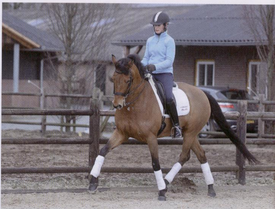
Tempowisselingen ook in zijgangen. Op de foto verruiming in schouder binnenwaarts.