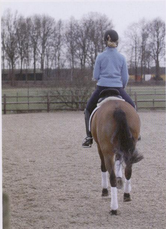
In galop wijken voor de kuit naar rechts, om het paard rechter te krijgen.

aanleunt, zet dan het hele paard opzij, en niet alleen de achterkant.' Tarina krijgt na het losrijden even een stappauze. 'Het is essentieel om tussendoor te stappen. Na een inspanning is ontspanning zowel fysiek als mentaal belangrijk voor een paard. Je kan in een trainingsuur beter twee keer te vaak stappen met lange teugel dan één keer te weinig. En vaak is twee rondjes stappen al genoeg. Stappen met lange teugel zorgt ervoor dat een paard weer op adem komt, het lichaam